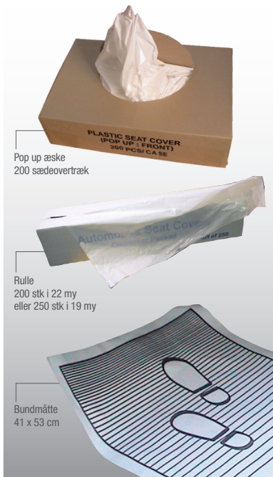
Pop up æske 200 sædeovertræk