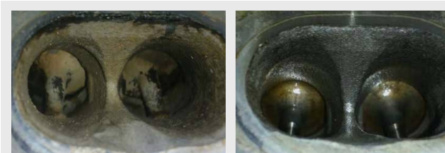
Ventiler før og efter rensning.